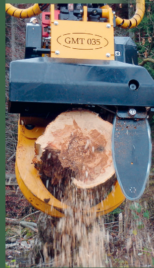
Fällgreifer GMT 035

Arbeiten, die unter erschwerten oder speziellen Bedingungen ausgeführt werden müssen, gehören zu unserer Spezialholzerei. Sei es, weil Strassen, Häuser und Parkanlagen miteinbezogen werden müssen, weil die Situation eine unkonventionelle Arbeitsweise erfordert oder nur ein spezieller Sicherheitskurs das Arbeiten an den Bahngleisen möglich macht.