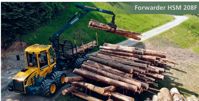
Forwarder HSM 208F