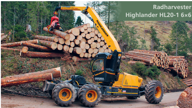
Radharvester Highlander HL20-1 6x6